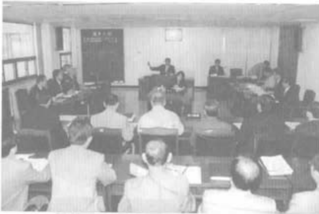
▲ 충청북도의회 농림수산위 장면